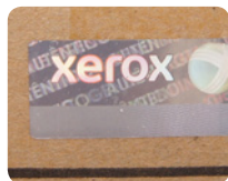
С ярлыка удален серийный номер