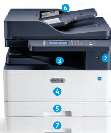
Многофункциональное устройство Xerox® B1025

Конфигурация DADF показана с опциональным дополнительным лотком.