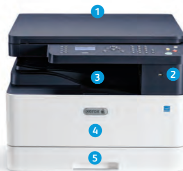
Многофункциональное устройство Xerox® B1022

9 МФУ Xerox® B1025 оснащено цветным сенсорным интерфейсом с диагональю 4,3 дюйма, дополнительно упрощающим работу.