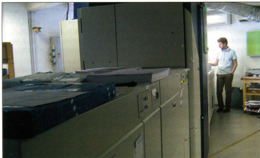
Геннадий Боев уже видит новые перспективы развития типографии. ЦПМ так велика, что снимать её пришлось именно в такой перспективе

Пока рабочие выполняли таке-лаж, мы с Геннадием обсуждали специфические требования к ЦПМ, соответствие им новой машины и её достоинства на фоне iGen3. Важное свойство для типографии, которая сосредоточена на рекламе, — отличное качество печати почти по любым фактурам, что на практике означает большую универсальность машины в отношении материалов. Ультразвуковой перенос тонера гарантирует хорошую пропечатку на большинстве фактурных бумаг. Плотные плашки без проплешин и полошения — тоже важное до-