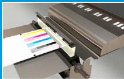
Матрица по всей ширине (Full Width Array, FWA)

Автоматическая приводка гарантирует идеальное выравнивание и совмещение изображения при двусторонней печати, независимо от размера листа или типа материала. Позволяет экономить время, устраняя отходы из-за неправильного совмещения или перекоса изображения.